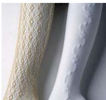
Netzstrumpfhose, 1969 und Strumpfhose 1968/1970

Die siebente Dekade von 1960 bis 1969 steht im Zeichen des Umbruchs und des Minis. Neben dem äußerst vornehmen Jackenkleid aus grauem Wollstoff sieht man ein Minikleid aus erbsgrünem Musselin , Hotpants aus pflaumenblauem Samt , einen Hosenzug in shocking Pink aus Shantungseide und einen Mantel mit Oberteil in Op-Art. Dazu gehören anfangs noch Stiletos später die flachen bequemen Pumps. Selbstverständlich fehlen auch die ersten Strumpfhosen , die Revolution in der Strumpfmode nicht.