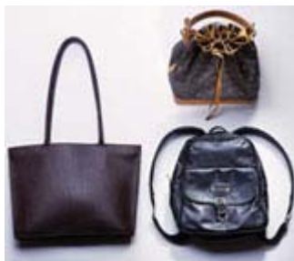
aus dem Studio Unit-F.