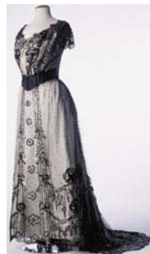
Balkkleid, um 1900

Die zweite Dekade von 1910 bis 1919 präsentiert die bis zum Ersten Weltkrieg dominierende Linie der Empireform. Besonders elegant das Nachmittagskleid aus grauem Faille und das Balkkleid aus silber- und goldfarbenem Seidenbrokat aus dem Salon von Christoph Drecoll. Das Kostüm aus schwarzem Seidentaft kündigt bereits die neue gerade Linie der 20er Jahre an. Sehr charakteristisch sind die anfangs noch wagenradgroßen Hüte. Der Hermelinmuff , das Silberdrahttäschchen und die Trotteurschuhe aus weißem Glacéleder sind Beispiele hervorragender Handwerkskunst.