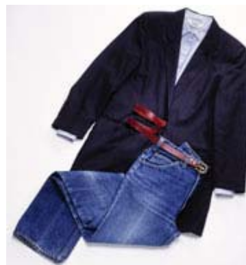
Blazer, 1989, Jeans 1982/1983 und Bluse, 1982

Die zehnte Dekade von 1990 bis 1999 setzt die Trends der 80er Jahre fort. Noch mehr gilt die Devise "Erlaubt ist, was gefällt". Ein modisches must ist allerdings der Hosenzug . Der hier gezeigte aus changierendem schlammgrauem Wollstoff ist von Giorgio Armani. Er steht neben einem Sommerkleid aus bunt bedruckter Viskose , einem Kleid aus olivgrüner gecrashter Kunstfaser und einem schlicht-elegantem Kleid aus dunkelblauem Wollstoff . Auch ein früher Cityrucksack , ein Matchsack von Louis Vuitton und große Handtaschen sind zu sehen. Daneben gibt es Pumps und Stiefeletten. Erotisch zeigt sich die Unterwäsche, etwa " Waterbra ", Tanga und Body aus Elastan . Ebenso die Badeanzüge und der Bikini .