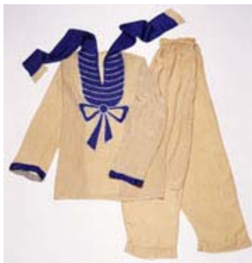
Pyjama, 20er Jahre 20. Jhd.

Die fünfte Dekade von 1940 bis 1949 ist geprägt vom Zweiten Weltkrieg. Improvisation ist alles. Schlicht und einfach zeigt sich das bestickte Nachmittagskleid aus rostbraunem Wollstoff , streng, fast militärisch das Kostüm aus weißem Leinen. Typisch sind die gezeigten Turbane , ebenso die Schuhe mit Holzsohlen , das selbstgestrickte Unterkleid und der berühmte Strumpfzauber . Der "New Look", 1947 von Christian Dior kreiert, bestimmt bis weit in die 50er Jahre die Silhouette. Der Zweiteiler mit dem eng taillierten Oberteil aus schwarzem Samt und dem weit ausschwingenden wadenlangen Rock aus schwarzem Kunstseidenmoiré steht dafür.